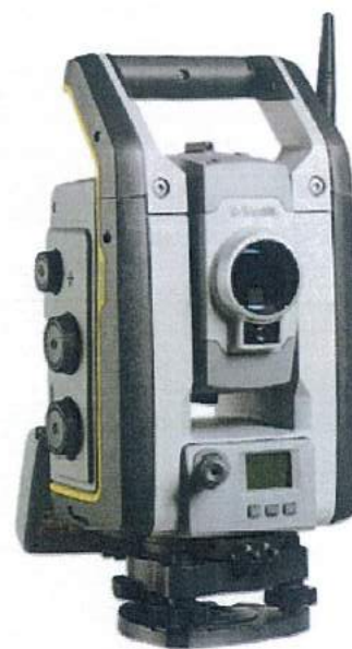
Рисунок 3 - Общий вид тахеометров электронных Trimble S7

Пломбирование крепёжных винтов корпуса не производится, ограничение доступа к узлам обеспечено конструкцией крепёжных винтов, которые могут быть сняты только при наличии специальных ключей. Все внутренние винты залиты специальным лаком.