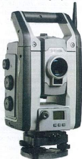
Рисунок 1 - Общий вид тахеометров электронных Trimble S9, Trimble S9 HP

Общий вид тахеометров электронных Trimble S5, Trimble S7, Trimble S9, Trimble S9 HP представлен на рисунках 1 - 3.