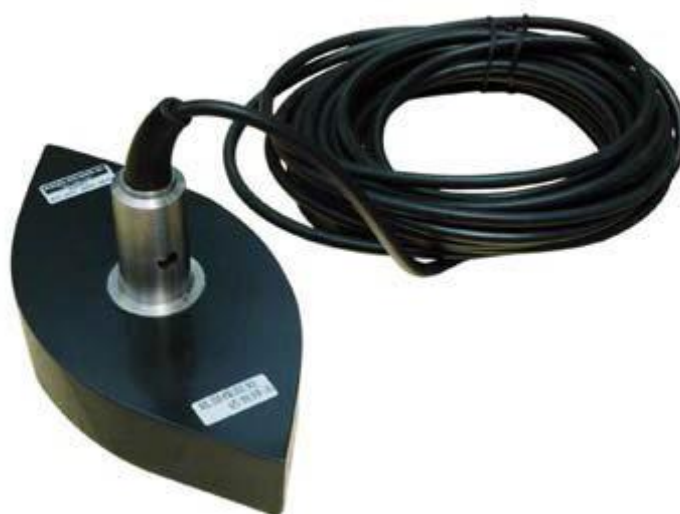
Рисунок -2 Блок приёмно-передающего устройства