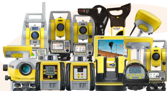
Авторизованный партнер GEOMAX