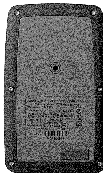
Рисунок 2 - Внешний вид аппаратуры со стороны задней панели